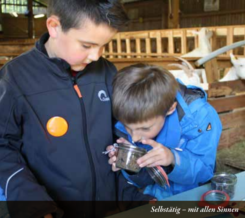
Selbsttätig – mit allen Sinnen