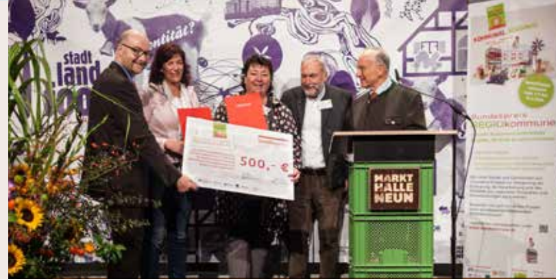
Lernort Vulkanhof: Auszeichnung Bundespreis Regiokommune 2016