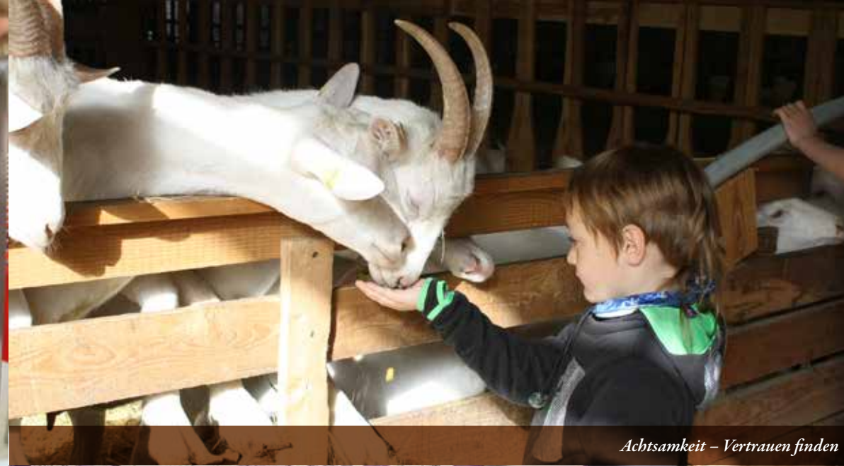
Achtsamkeit – Vertrauen finden